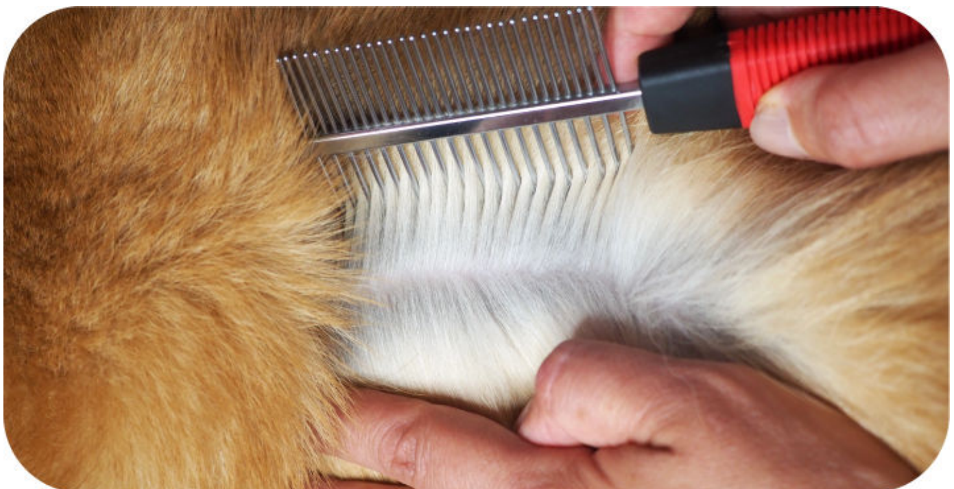
Ein Flohkamm ist ein nützliches Werkzeug, um Flöhe bei deinem Vierbeiner zu identifizieren